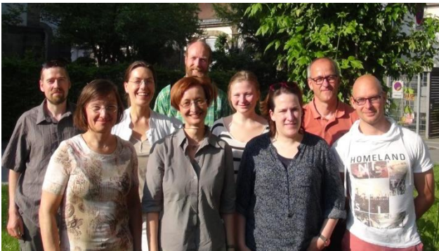
das interdisziplinäre DreKiP-Team