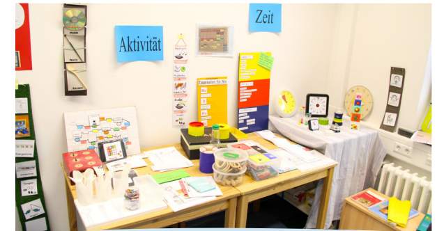
Strukturierung und Visualisierung