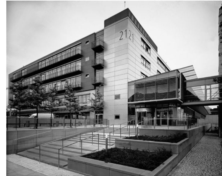
Universitätsklinikum Carl Gustav Carus Dresden Klinik und Poliklinik für Kinder- und Jugendmedizin