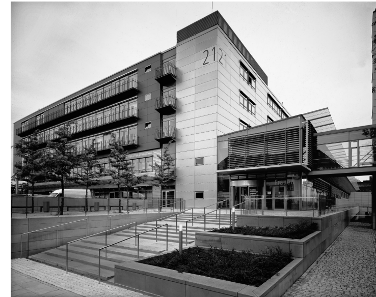
Kinder- und Frauenklinik des Universitätsklinikums Dresden