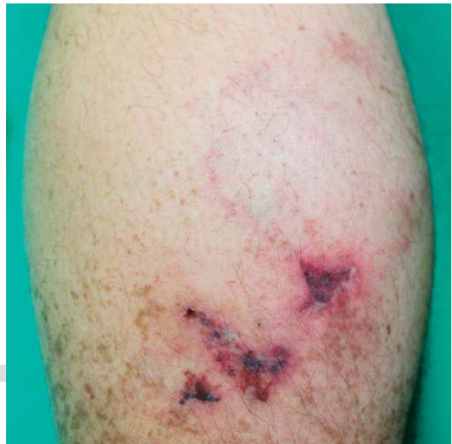
► Abb. 1 Hautbefund der Wade mit Livedozeichnung und Ulzerationen vor Beginn der Therapie.

Nach aktueller Studienlage [6] leiteten wir eine Antikoagulation mit Rivaroxaban (Xarelto®) 10 mg zweimal täglich ein. In Kombination mit einer desinfizierenden Lokaltherapie zeigte sich bereits im stationären Verlauf eine Besserung des Hautbefundes und der Schmerzsymptomatik. Die Dosis des Rivaroxaban wurde nach Sistieren der Schmerzen auf 10 mg einmal täglich reduziert. Diese Dosis wird seither als Dauertherapie fortgeführt. Drei Monate nach Entlassung stellte sich der Patient im Rahmen einer Nachkontrolle erneut bei uns vor. An der Wade zeigte sich narbig, atrophisierte Haut ohne frische Ulzerationen oder Erytheme (► Abb. 2 ). Schmerzen wurden vom Patienten verneint.