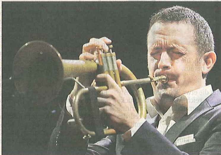
In der Uniklinik tritt der Trompeter und Dresdner Musikdozent Till Brönner heute mit seinem Programm „Talkin' Jazz“ auf.