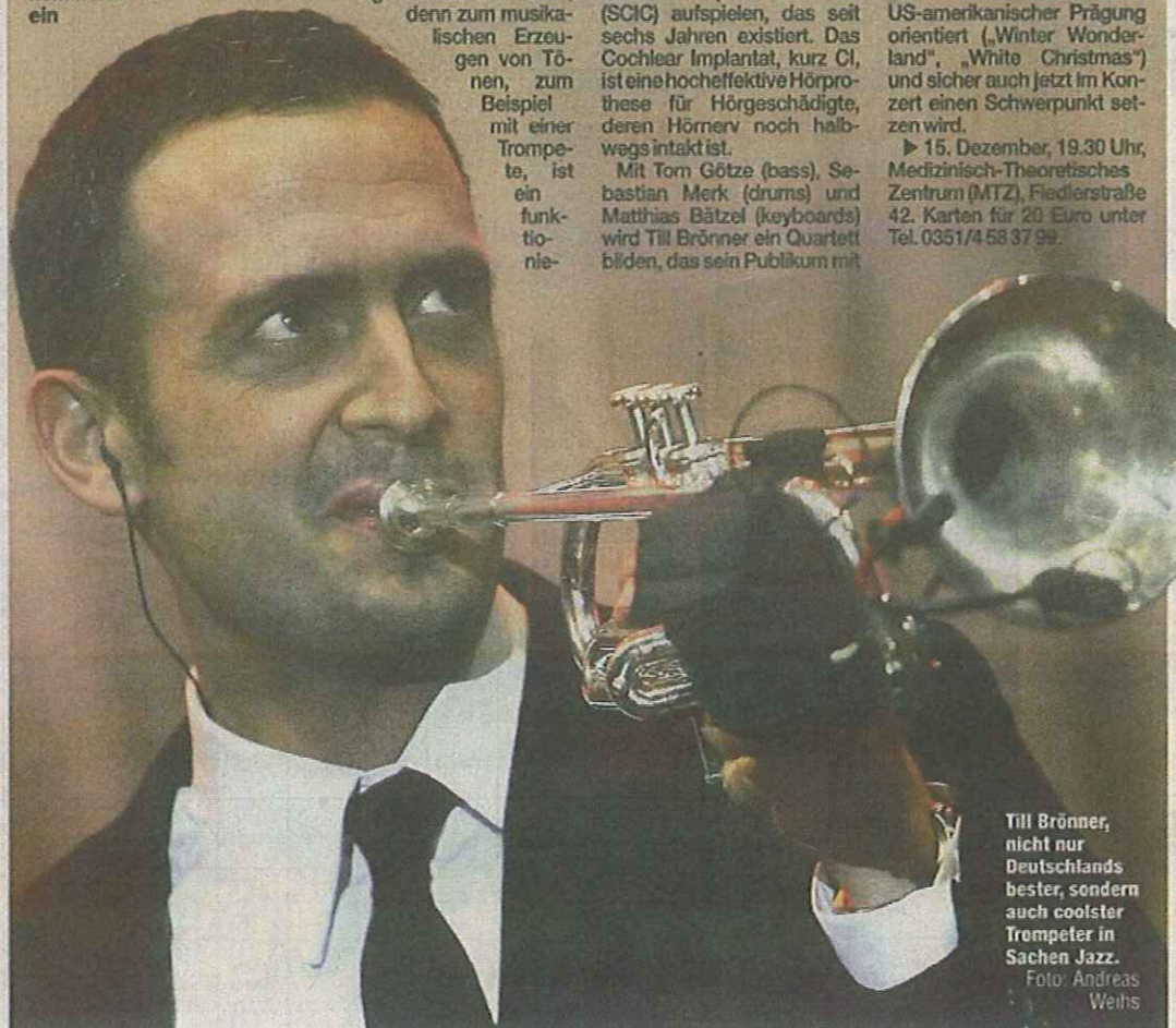
Till Brönner, nicht nur Deutschlands bester, sondern auch cooler Trompeter in Sachen Jazz.

► 15. Dezember, 19.30 Uhr, Medizinisch-Theoretisches Zentrum (MTZ), Fiedlerstraße 42. Karten für 20 Euro unter Tel. 0351/4 58 37 99.